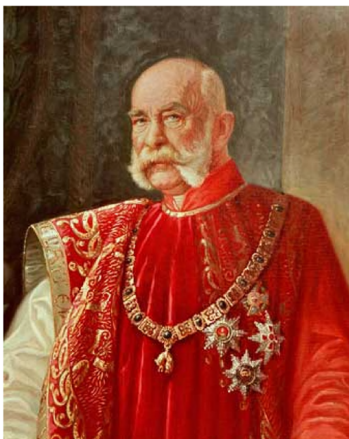
Рис. 2 – Император Франц Иосиф

Важной наградой Австрийской империи был орден Франца Иосифа. Надо сказать, что орден был учрежден как первая всесловная награда. Возможно, на подобное уважение к низшим сословиям императора подвигла революция 1848 г. Император Франц Иосиф I учредил награду в честь своей первой годовщины восшествия на престол. Орден Франца Иосифа давали как за гражданские, так и за военные заслуги. Иностранцы получали награду по личному усмотрению монарха. Девиз ордена был: «Едиными усилиями». Он имел 3 степени: Большой крест, Командор и Рыцарь. Количество награждаемых не лимитировалось.