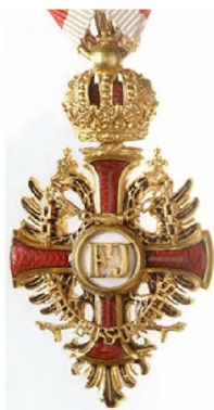
Рис. 6 – Орден Франца Иосифа

Однако не только морские офицеры получали Орден Почетного легиона. Самым известным из военно-морских офицеров, награжденных Орденом Почетного легиона, был в 1857 г. генерал-адмирал, великий князь Константин Николаевич [8]. Не обходили Орденом Почетного легиона и русских деятелей культуры. Например, в 1858 г. его был удостоен профессор Императорской академии художеств И.К. Айвазовский, одновременно являвшийся живописцем Главного морского штаба.