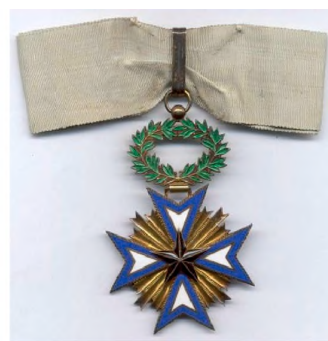
Рис. 7 – Орден Черной звезды 3-й степени

Удивительной французской наградой был Королевский орден Камбоджи. Он возник в 1864 г. по инициативе короля Камбоджи Нородома I, а позднее Французская Республика утвердила королевский орден Камбоджи как собственную колониальную награду. Орден имел пять степеней: Большой крест, Гранд-офицер, Командор, Офицер и Рыцарь.