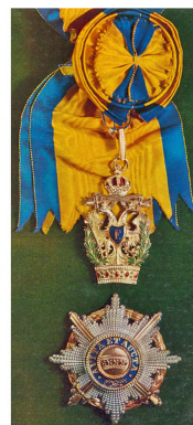
Рис. 1 – Орден Железной короны