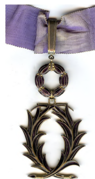
Рис. 4 – Орден Академических пальм

Еще одной известной австрийской наградой был Крест за заслуги, введенный императором Францем Иосифом I 22 октября 1849 г. Им наградили в 1859 г. за спасение экипажа торгового судна «Ammirabile» старшего боцмана Воронова. Интересно, что кроме награждений император Франц Иосиф I выразил свою высочайшую благодарность организовавшим спасательную операцию австрийского торгового судна командиру корабля «Ретвизан» капитану 1-го ранга барону Таубе и старшему офицеру капитан-лейтенанту барону Штакену [12]. В 1908 г. командорский крест ордена Леопольда получил контр-адмирал свиты Его Императорского Величества граф Гейден [13].