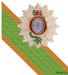
Рис. 5 – Орден Дракона Аннама 2-й степени

Одной из самых престижных стран для русских моряков в плане наград страной всегда была Франция. И самая главная из французских наград – Орден Почетного легиона, учрежденный Наполеоном Бонапартом 19 мая 1802 г. Первоначально орден имел только одну степень, но затем их стало три: Командор, Офицер и Кавалер и два достоинства: Большой крест и Великий офицер [6]. Награда вручалась за военные или гражданские заслуги независимо от пола обладателя. Девиз ордена звучит как «Честь и Отечество» [7].