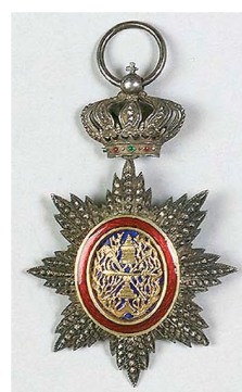
Рис. 3 – Королевский орден Камбоджи

Очень богатую историю имел императорский австрийский орден Леопольда. В эпоху наполеоновских войн увеличилось количество подвигов, заслуживающих внимания со стороны австрийского императора. В итоге было решено основать новый орден, названный в честь отца правящего монарха Франца I. Поводом для объявления о награде стала помолвка Франца I с третьей супругой герцогиней Моденской Марией-Людовикой, состоявшаяся 8 мая 1808 г. Орден стал наградой за гражданские и военные заслуги, а также за успехи в науке, искусстве, литературе. Первоначально его получили эрцгерцоги Иоганн и Райнер вместе с 11 высшими австрийскими сановниками. Вместе с орденом вручали свидетельство о факте награждения. Первоначально орден Леопольда имел 3 степени: Большой крест, командор и рыцарь. В 1901 г. Большой крест разделили на Большой крест и Крест I степени. В 1874 г. Большой крест ордена Леопольда пожаловали управляющему Морским министерством, генерал-адъютанту, адмиралу Крабе [11].