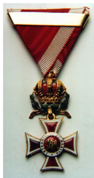
Рис. 9 – Рыцарский крест Австрийского ордена Леопольда

Другой колониальной французской наградой был Орден Черной звезды. Его учредили в Порто-Ново, сегодня государство Бенин, 30 июля 1894 г. Автором ордена стал местный король Дагомей Тоффа. Официально награда давалась за упрочение французской политики в Западной Африке. Орден Черной звезды имел пять степеней: Большой крест, Великий офицер, Командор, Офицер, Кавалер. В 1901 г. командорский крест Ордена Черной звезды торжественно вручили капитану 2-го ранга Бэру 2-му. Кстати, Орден Черной звезды очень широко раздавался французами союзникам в период Первой мировой войны, что привело к награждению им целой группы офицеров русского флота.