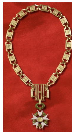
Рис. 10 – Цепь магистра Ордена Почетного легиона